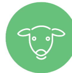
Структура вирощування сільськогосподарських тварин за категоріями господарств у 2020 році